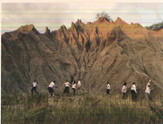
△ 社群教師於龍崎月世界進行即興舞蹈