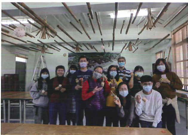
△ 在左鎮公館社區體驗月世界的刺竹特色產業竹陀螺