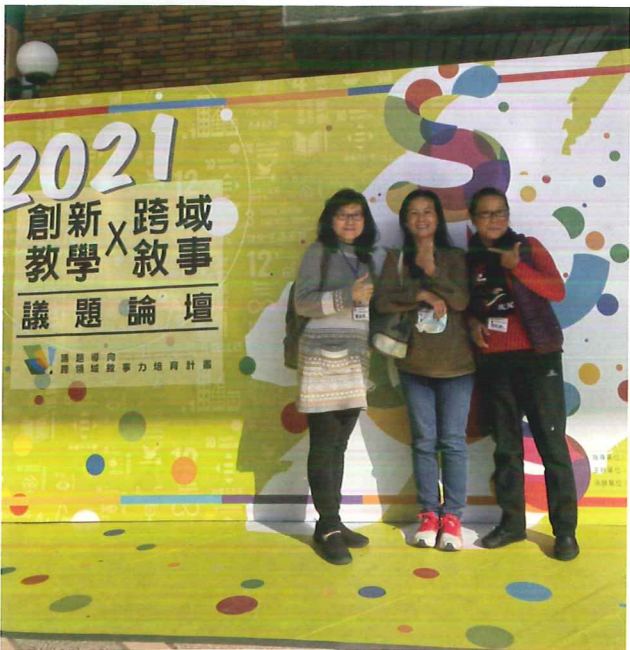
△ 參加計畫總辦公室之2021議題論壇