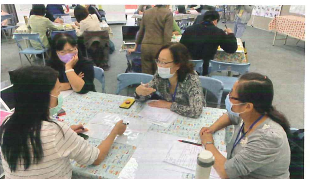
△ 參加嘉南區分區基地之概念設計培力研習

透過社群培力與課程規劃，於109學年度第二學期開設兩門創新課程，分別為「環境與人專題」、「觀光景點英語導覽」，同時發表了〈課程概念發想與探究-以月世界場域為例〉、〈PBL問題導向課程設計-「環境與人」的永續對話〉等兩篇教學實踐海報論文外，亦有〈「月世界的美麗與哀愁」一教材教法分析與省察〉之教案論文發表並進行公開演示，透過課程的開設，以及教學實踐論文以及教案演示，都展現出社群經營以及教師跨域交流的成果。